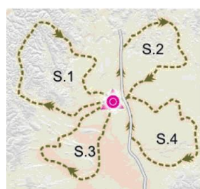
TRAZADO EN ESTRELLA