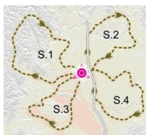
TRAZADO EN ESTRELLA